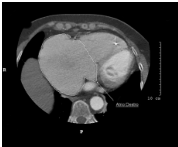
Figura 2. Immagine tomografica assiale computerizzata multidetettore, sezione trasversale, di donna affetta da paralisi atriale persistente, forma totale.

gnosi è poco nota: i pochi dati disponibili in letteratura indicano un'evoluzione molto lenta. In seguito al sopraggiungere di episodi sincopali o di una bradicardia